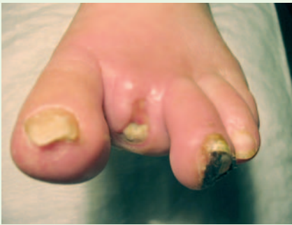
20.10.2005 - Sclerodermia al termine del terzo ciclo (3 mesi) di antibiotico-terapia mirata.