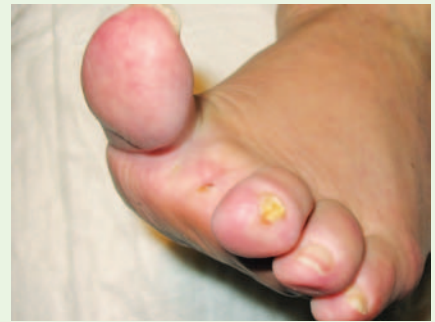
28.1.2006 - Dopo 3 mesi e mezzo di risciacqui.