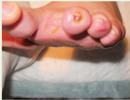
15.12.2005 - Dopo 2 mesi di risciacqui.